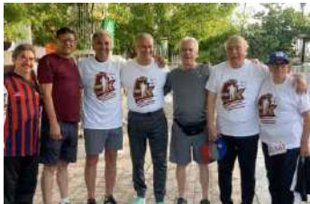
Asistimos a diferentes actividades deportivas y de promoción de la salud, resaltando la importancia de mantener un estilo de vida saludable en nuestra comunidad.