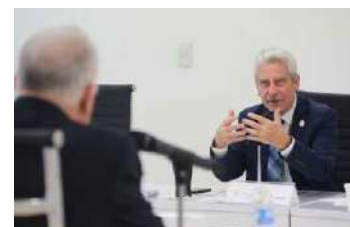
Participo en las entrevistas a los 22 aspirantes a la Comisión de Derechos Humanos de Tamaulipas.