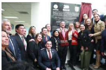
Bicentenario del Congreso del Estado de Tamaulipas.