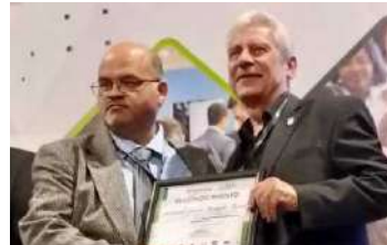
Participo en diferentes foros y congresos sobre temas laborales y legislativos.