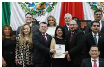
En la entrega del Segundo Informe de Gobierno del Dr. Américo Villarreal Anaya.