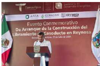
Asistí a diferentes eventos de promoción del desarrollo económico e infraestructura de la entidad.