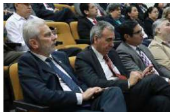
Acudí al encuentro académico interdisciplinario "Tamaulipas 200 Años de Historia Compartida".