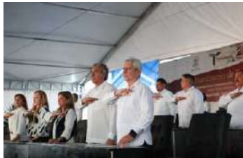
Asistimos a la conmemoración del 200 aniversario del Constituyente de Tamaulipas, hecho histórico que celebra los cimientos de nuestra identidad y autonomía como estado.